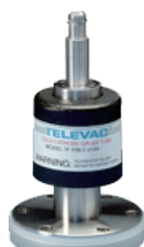
7F Cold Cathode