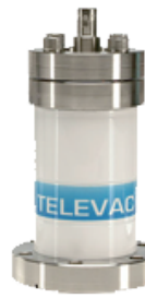
7FC, 7FCS Cold Cathode