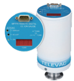
MP7FR Cold Cathode