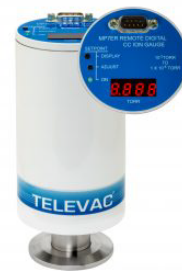
MP7ER Cold Cathode