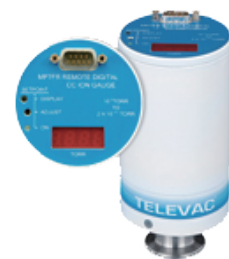
MP7FR Cold Cathode