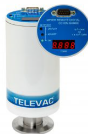
MP7ER Cold Cathode