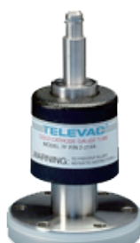
7F Cold Cathode